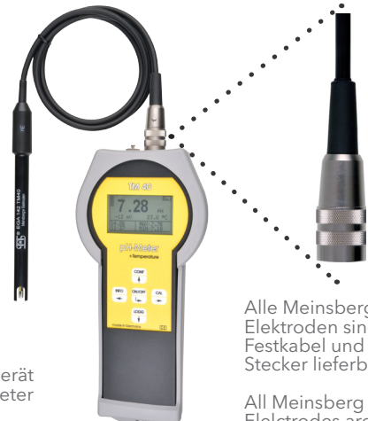
pH-/Redox-/ISE-Messgerät mit Stoßschutz pH/Redox/ISE Meter with protective cover

Alle Meinsberger Elektroden sind mit Festkabel und BK-Stecker lieferbar. All Meinsberg Electrodes are available with fixed cable and connector BK.