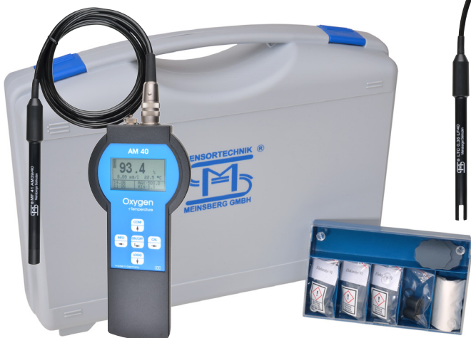
AM 40/Set mit Sauerstoffsensoren MF41N/AM40 AM 40/Set with Oxygen Sensor MF41N/AM40