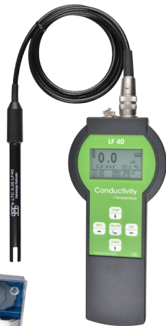
Leitfähigkeits-Messgerät Conductivity Meter