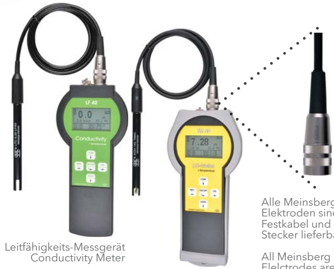
Leitfähigkeits-Messgerät Conductivity Meter pH-/Redox-/ISE-Messgerät mit Stoßschutz pH/Redox/ISE Meter with protective cover

Alle Meinsberger Elektroden sind mit Festkabel und BK-Stecker lieferbar.