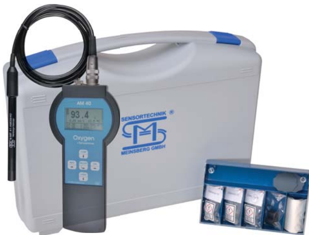
AM 40/Set mit Sauerstoffsensoren MF 41-N/AM 39/40 AM 40/Set with Oxygen Sensor MF 41-N/AM 39/40